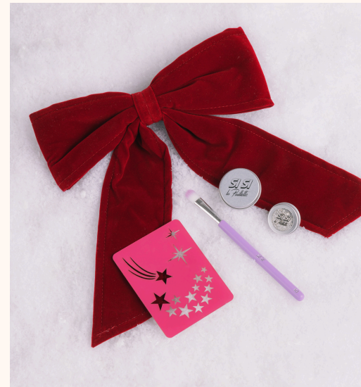
Si Si la paillette Coffret Étoiles Paillettées 21,90 €