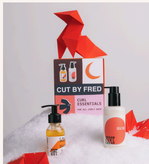
Cut by Fred Curl Essentials 30,00 €