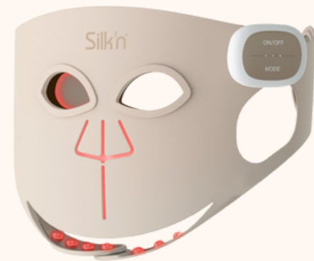
Silk'n Led Mask Pro 249,99€