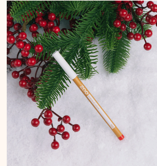
Zao Crayon Audacieux 658 Le Rouge 9,90 €