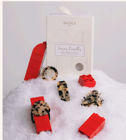
Bachca Coffret Trésors Écaille 25,00 €