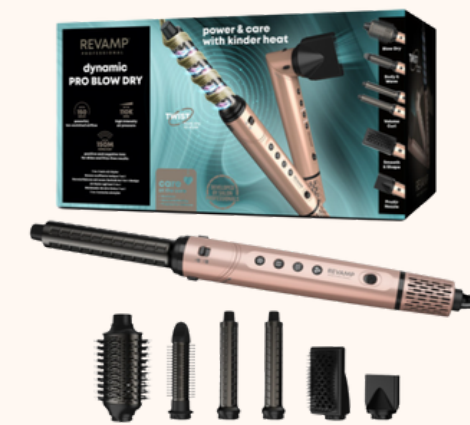
Revamp Air-Styler Dynamic Radiance 199,99€