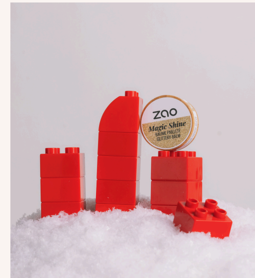
Zao Baume Magic Shine 292 Doré 10,50 €