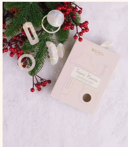
Bachca Coffret Trésors Nacrés 25,00 €