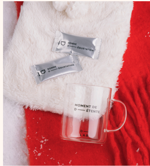
D-LAB Nutricosmetics Coffret Pro-Collagène Détox + Mug offert 39,00 €