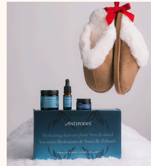
Antipodes Routine Booster D'hydratation 50,00 €