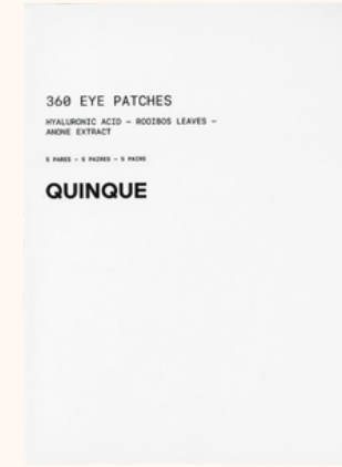
Quinque Patches Pour Les Yeux 360° 30,00€