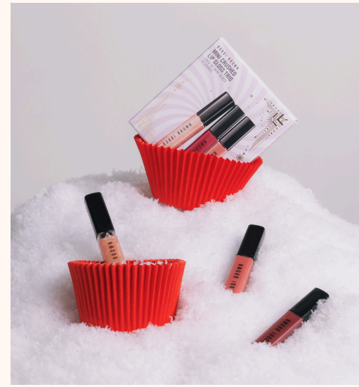
Bobbi Brown Mini Crushed Lip Gloss Trio 55,00 €