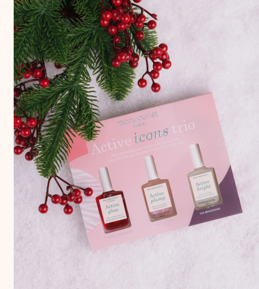
Manucurist Active Icons Trio 39,00 €