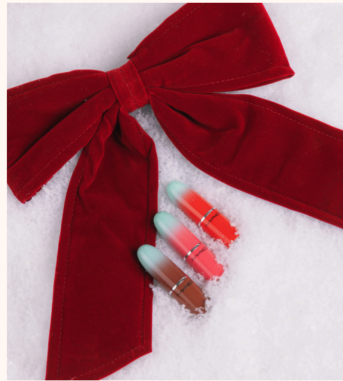
M·A·C Cosmetics Wildest Gleams Mini Lustreglass Lip Trio : Brights 32,00 €