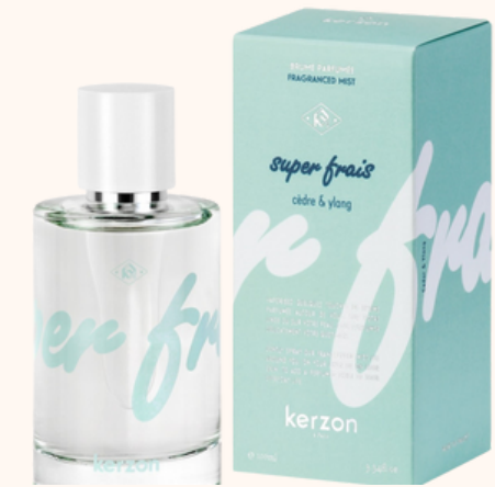
Kerzon Brume parfumée Super Frais 39,00€