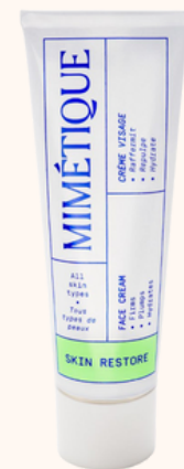
Mimétique Skin Restore - Crème Visage 66,00€