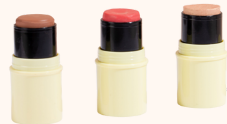
Pomponne Trio Fantastick - Bronzer+ Blush Hibiscus+ Highlighter 72,90€