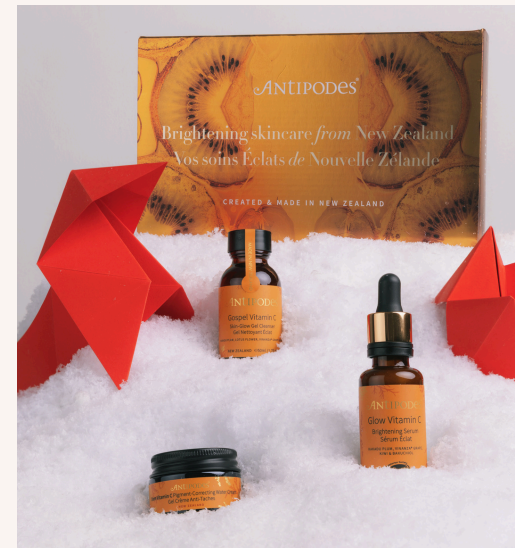
Antipodes Routine Booster D'éclat 57,00 €