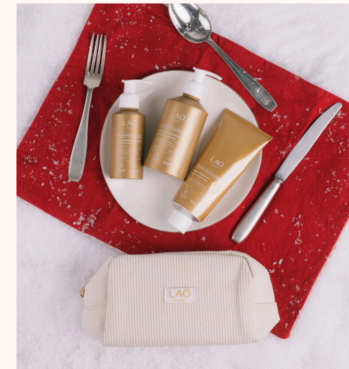
Lao Care Cure Régénérante Intense Protein Bonding 89,70 €