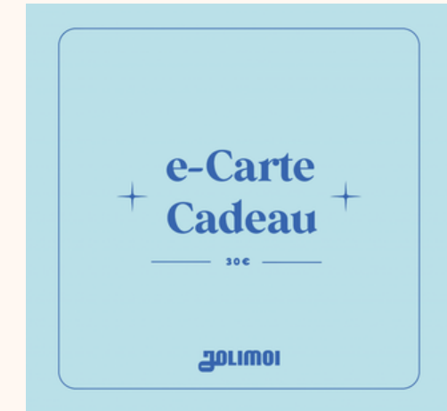
Jolimoi e-Carte Cadeau 30,00€