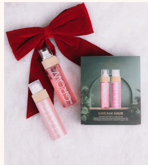
Cocosolis Dream Hair 65,86 €