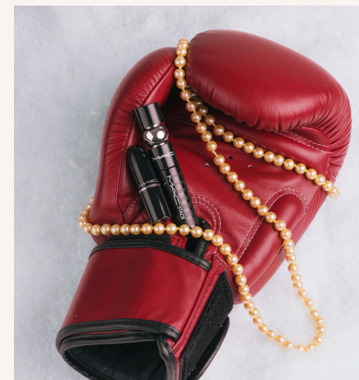
M·A·C Cosmetics Future Favourites Mini Lip And Eye Kit 25,00 €