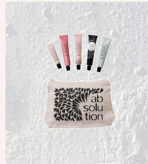
Absolution Le Best Beauty Friend 55,00 €