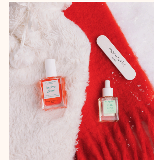
Manucurist Bestseller Ornament 19,00 €