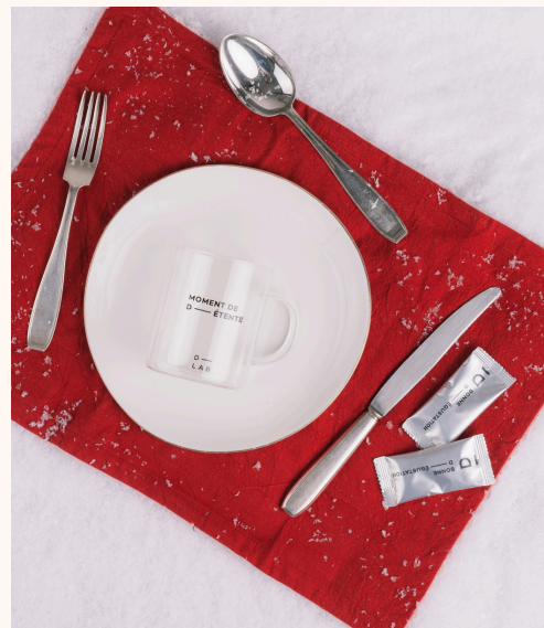
D-LAB Nutricosmetics Coffret Pro-Collagène Peau Neuve Choco- Noisette + Mug offert 39,00 €