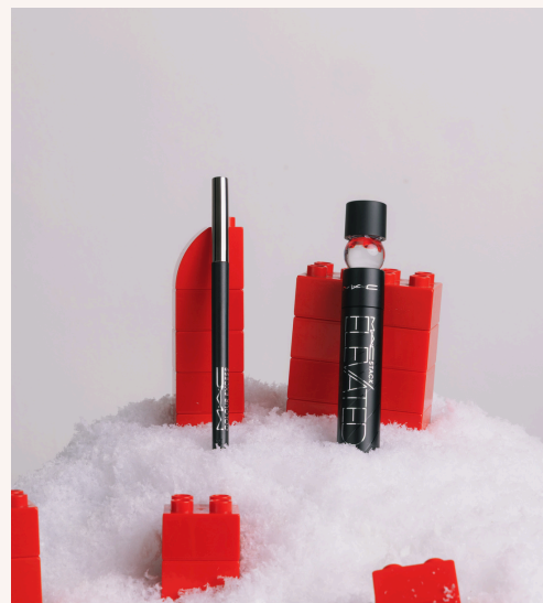
M·A·C Cosmetics Foreseeable Future Eye Kit 39,00 €