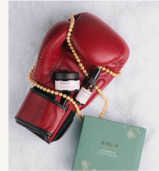
Evolve Moisture Boost Duo 28,00 €