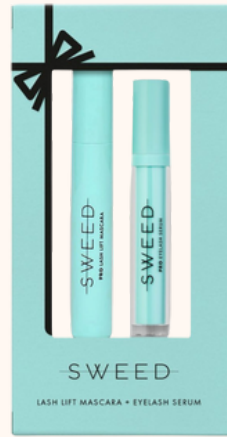
Sweed Lash Lift Gift Set 68,00€