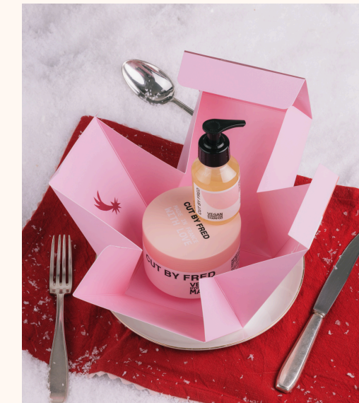
Cut by Fred Hydration Essentials 39,00 €