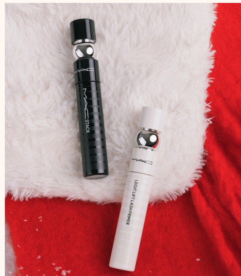
M·A·C Cosmetics Stacked To The Macstack Lash Duo 43,00 €