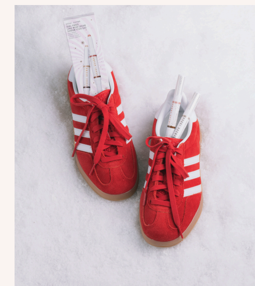
Bobbi Brown Dual-ended LW Cream Shadow Stick Duo 75,00 €