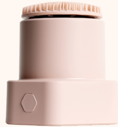
Lauvée Brosse nettoyante 149,00€