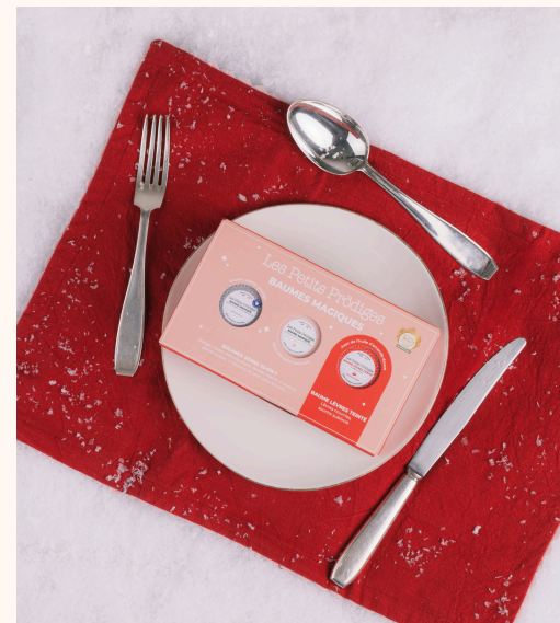
Les Petits Prédiges Coffret Les Mini Baumes 19,00 €