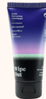
Seventyone Percent Wipe out 21,90€