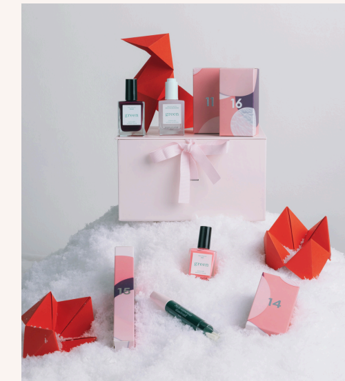
Manucurist Calendrier de l'Avent 139,00 €