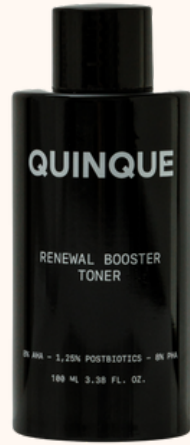
Quinque Renewal Booster Toner 43,00€