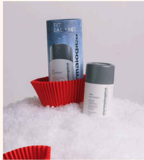
Dermalogica Petite Pleasures Set 22,00 €