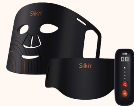
Silk'n Dual Ledmask 399,00€