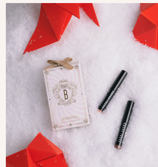
Bobbi Brown Mini Shadow Stick Duo 36,00 €