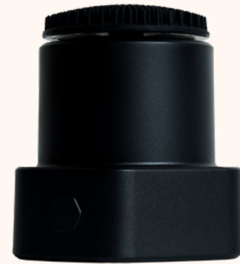
Lauvée Brosse nettoyante 149,00€