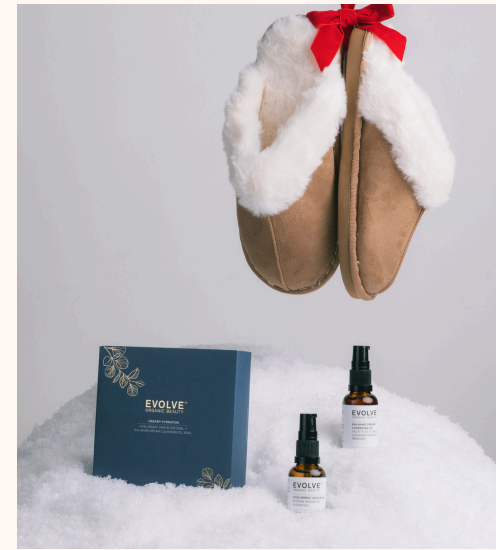
Evolve Dreamy Hydration 38,00 €