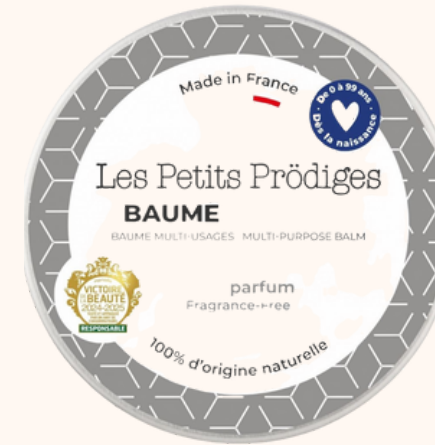
Les Petits Prédiges Baume multi-usages Sans parfum 17,90€