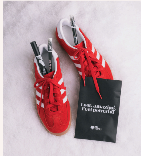
All Tigers Coffret De Noël 30,00 €