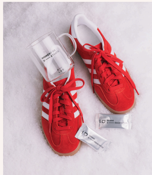
D-LAB Nutricosmetics Coffret Pro-Collagène Minceur Kiwi + Mug Offert 39,00 €