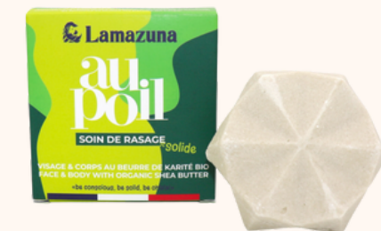
Lamazuna Pain de rasage solide AuPoil 12,50€