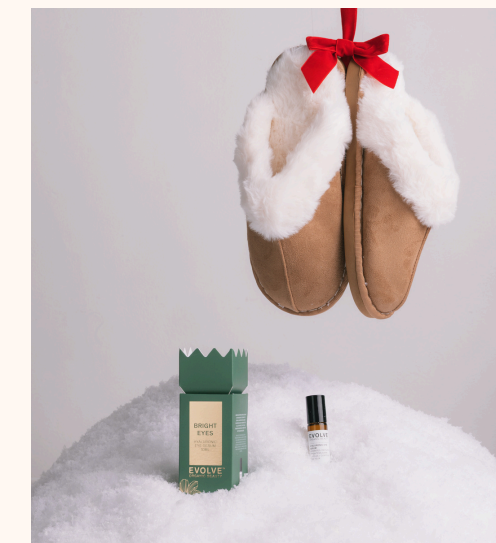
Evolve Bright Eyes 18,00 €