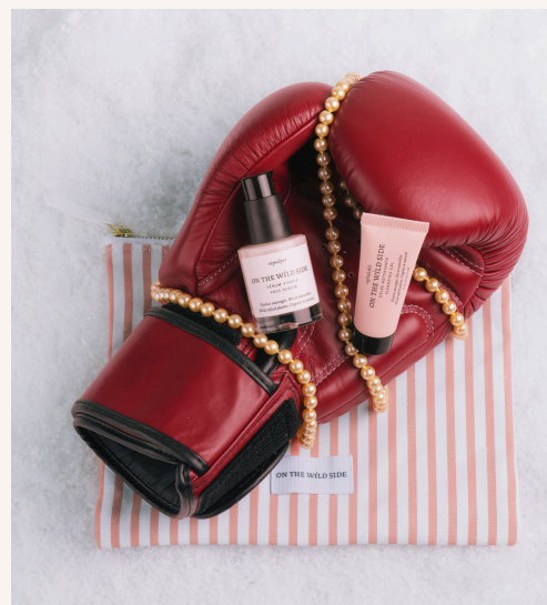
On The Wild Side Rituel Repulpant 45,00 €