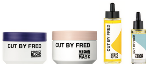
LES SOINS PROFONDS & SÉRUMS